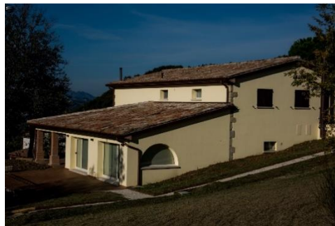
CASA DEL GIOVANE Via Mario Tosini, 28 – Tel.0549-878228 47031 RSM FIORENTINO